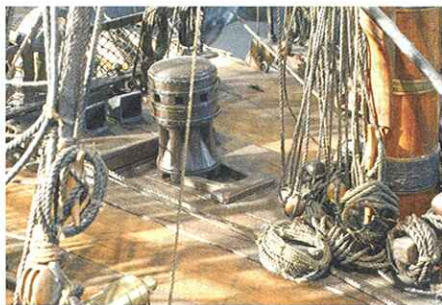
Gaillard avant, avec le petit cabestan et le panneau des cuisines sur l'arrière.