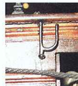
Branche pivotante, fixée sous le bordé de plat-bord au niveau des passavants. Son utilité précise n'a pas été déterminée.