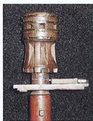
Petit cabestan, avec l'étambrai, les linguets et le traversin. La mèche présente en partie inférieure une surépaisseur et un tenon de section carrée destinés à tourner quelques manœuvres.