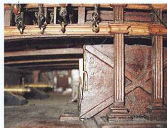
Entrée bâbord du gaillard avant. De chaque côté des cuisines, le pont est protégé par un bordé recouvert d'une feuille en fer blanc. Sur la mouluration du fronton, sont fichées quatre boucles pour les cargues-fond et cargues-boulines de la grand-voile. À noter les affûts cachés par les ponts, réduits à leur plus simple expression. Étonnant, vu la qualité du modèle.