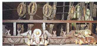
Aménagement de l'entrée du gaillard arrière. Les taquets à oreilles n'ont pas été attribués.