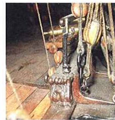
Dernier chandelier du gaillard avant, à la forme particulière. Il reçoit sur son extérieur le premier élément du garde-corps du passavant. À remarquer la dissymétrie du pied, avec l'absence de relief sur l'intérieur.