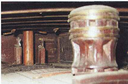
Même vue, prise de tribord. En premier plan, la cloche supérieure du grand cabestan avec son traversin de linguet sur l'avant. Au devant de la cloison de la grande chambre, le mât d'artimon est entouré de deux pompes royales et quatre galoches sont fixés sous les barrots du gaillard pour la drosse de l'axiomètre. La cloison latérale de la boucherie est visible sur bâbord. Il manque la volée supérieure de la grande échelle.