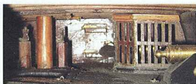
Vue de l'arrière du second pont. La cloison de la grande chambre est en fond de plan, avec à bâbord sa porte d'accès et la boucherie. Celle-ci est réalisée par des panneaux à claire-voie, bien entendu démontables pour la mise en œuvre du canon situé à l'intérieur.