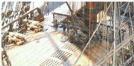
Vue 3 / 4 arrière du gaillard arrière. L'étai du mât d'artimon se termine par une poulie pour sa ride. Cette dernière, au dormant à bâbord, est elle-même ridée par deux caps de mouton sur tribord.