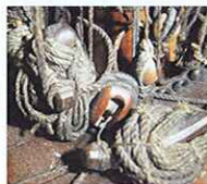
Gros plan sur la poulie de guinderesse du petit mât de hune. Son estrope se fixe autour d'un traversin placé sous le pont du gaillard.