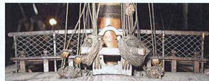
Fronton du gaillard arrière vu de la poupe. En premier plan, le biton de grand mât, renforcé par une entretoise entre les montants, est fixé sur le dessus du pont. De chaque côté, deux poulies doubles et un taquet à cornes sont destinés aux boulines de perruche ainsi qu'aux cargues-fond et cargues-boulines du grand hunier.