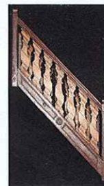
Volée supérieure de la grande échelle, richement décorée.