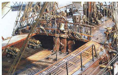
Vue d'ensemble 3 / 4 arrière des passavants et du gaillard avant.