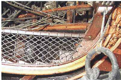
Garnitures de la grande herpe. Elles épousent sur l'arrière le siège d'aisance et la courbe du bossoir.