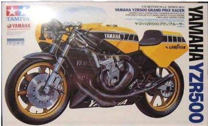
Kit base per conversione