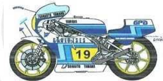
Yamaha YZR 500 Sonauto Patrick Pons 1980